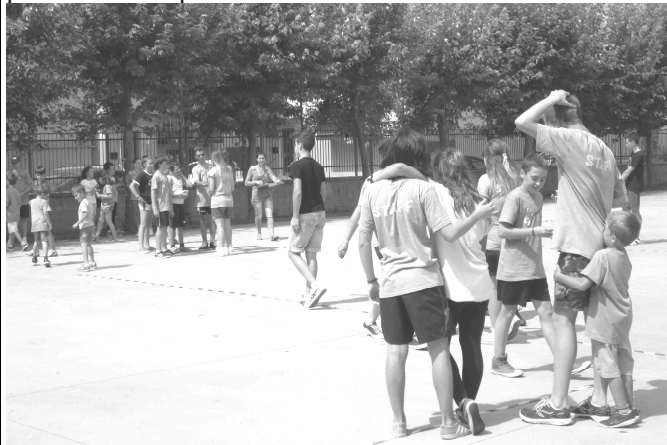
immagine di... qualche anno fa

Contiamo su di voi e ringraziamo già da ora quanti si presenteranno per dare una mano.