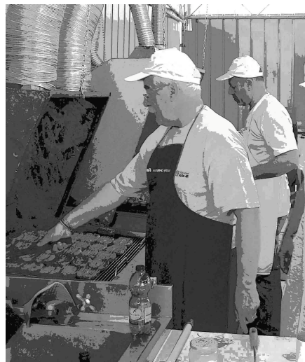
volontari in cucina