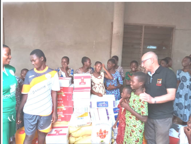
FOTO RICORDO DAL BENIN