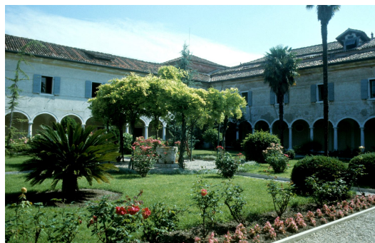
il chiostro porticato rinascimentale.